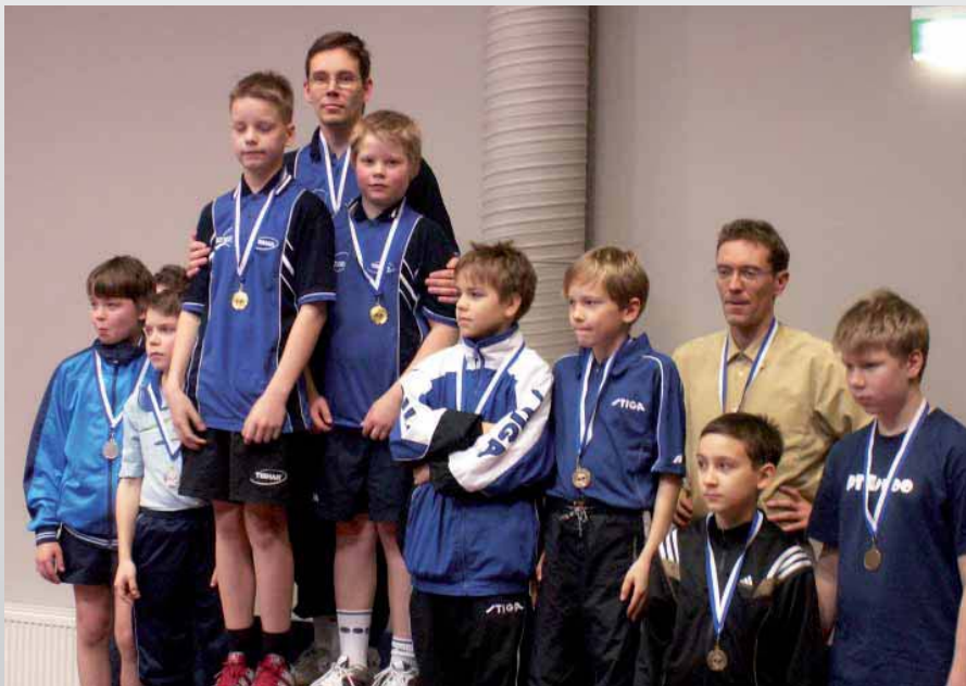
Poikien joukkuekilpailun mitalistit

T yttöjen mestaruutta lähti jahtamaan kuusi joukkuetta. Selvien semifinaalien jälkeen kahdella kovalla varustetut joukkueet TIP-70 ja KuPTS selvittivät itsensä finaaliin. Ottelujärjestys oli niin, että kakkospelaajat ja ykköspelaajat kohtasivat ennen nelinpeliä. Taktikointia siis, ainakin TIP-70:n puolesta toimiva, sillä kummatkin