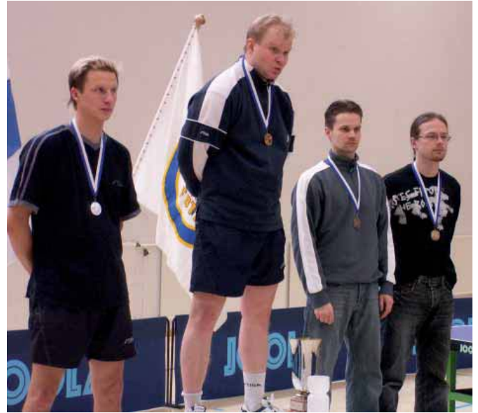
Miesten kaksinpelin mitalistit

Henkilökohtaiset SM-kilpailut pelattiin maaliskuun ensimmäisenä viikonloppuna Tampereella PT 75:n isännyydessä. Kisat olivat samalla järjestävän seuran 30-vuotisjuhlakilpailut.