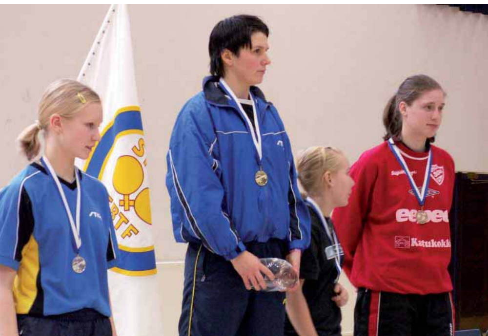
Naisten kaksinpelin mitalistit