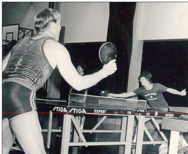
Yrityksen pöytätennisjaosto sai pian harrastuksen alkuvaiheessa käyttöön viralliset pelipöydät paikallisten yritysten ja yksityisten lahjoittamina.

Lähteet: Teuvo Komulaisen Waarinkivet-omaelämäkerta 2012; Padasjoen Historia, Elämää Päijänteen rannalla 2014; Padasjoen Urheilun Joulukalenteri 1974 ja 1975.