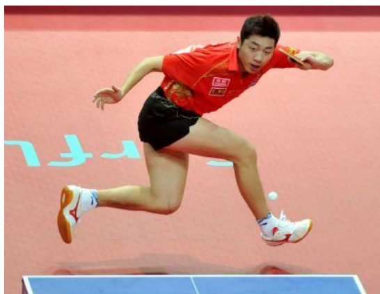
Xu Xin, ristiaskelluksen ”mestari”.

Liikuttaessa rystyltä syvälle kämmenkulmaan (oikeakätinen pelaaja) laitetaan vasen jalka oikean jalan etupuolelle ja viritetään samalla yläkroppaa lyöntiasentoon. Painopiste siirtyy täysin vasemmalle jalalle, joka toimii tukena tai ”pönnkänä”. Pelaajan kylki on pöydän vastaisesti. Lyöntihetkellä ylävartalo ja rintamasuunta kiertyy voimakkaasta lyöntiasennosta takaisin pöydän päädyn suuntaiseksi ja samalla oikea jalka siirtyy takaisin vasemman jalan oikealle puolelle hyvään peliasentoon.