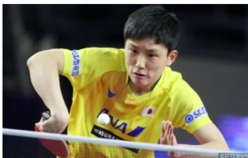
Japanin Tomokazu Harimoton pelissä rystypuolen pelaamisella on suuri merkitys. Lyöntivalikoimaan kuuluu myös ”banaaniflippi”

Vaikka kaikki lyönnit periaatteessa lähtevät jaloista, itse lyöntisuoritus tehdään rystypuolella hyvin vahvasti kädellä. Rystyssä kuten kaikessa muussakin pelaamisessa on tärkeää, että peliasento pysyy kunnossa. Alakierteestä avattiin toki rystyllä aikaisemminkin, mutta 2010-luvulla rystypelaaminen koki todella suuren muutoksen. Johdannossa mainittu ”banaaniflippi” muutti lajin pelitapaa ja rystypelaamiseen alettiin kiinnittää enemmän huomiota.