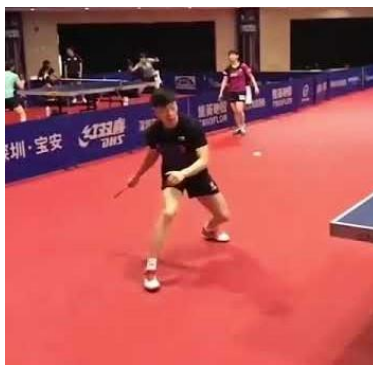
Ma Longin kämmenlyönnissä jalat ovat melkein vierekkäin, lantio ja ylävartalo tekevät voimakkaasti työtä

Yläkierteisessä kämmenlyönnissä, kämmenspinnissä, jalkojen asento on muuttunut jonkin verran vuosien varrella. Aikaisemmin ohjeistettiin lyömään kämmentä siten, että lyöntikäden puoleinen jalka on hieman tukijalkaa taaempana, jolloin saadaan maksimaalinen kierto yläkroppaan ja samalla ehkä myös hieman lisää aikaa lyönteihin. Nykypöytätennis on nopeutunut ja kun samalla rystylyönnin merkitys on kasvanut, jalkojen asento on muuttunut siten, että jalat ovat myös kämmenpuolella lähestulkoon rinnakkain. Näin puolenvaihto kämmeneltä rystylle tai päinvastoin on nopeampi toteuttaa.