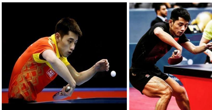
Zhang Jike, kaksinkertainen Maailmanmestari ja Olympiavoittaja Jike dominoi lajia 2010-luvun alussa stabiililla pelityylillä, jossa palloa pystyttiin ratkomaan aikaisemmasta poiketen vahvasti myös rystyllä. Ks. vahvoja jalkoja.

2010-luvun alussa nähtiin uusi lyönti, ”banaaniflippi”, jossa lyhyestä syötöstä haetaan isolta osalta pelipöytää rystypalautus. Palautuksessa palloa lyödään voimakkaasti pallon ala- /sivureunaan hipaisemalla, jolloin siihen tulee voimakas sivukierre. Flippi oli lyöntinä toki käy- tössä jo aikaisemmin, erityisesti kämmenpuolella, mutta uusi lyöntitekniikka mahdollisti vas- taanottajalle hyökkäämisen myös kovasta ja lyhyestä alakierreestä. Koska lyöntiä alettiin hakea koko pöydältä, rystypuolen merkitys pelissä kasvoi.