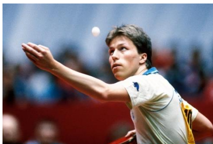
Jan-Ove Waldner, "pöytätenniksen Mozart" Pelinlukutaito, pallotuntuma ja syöttötyöskentely tekivät hänestä yhden kaikkien aikojen parhaista. Waldner on ainoa elossa oleva ulkomaalainen, josta on tehty postimerkki Kiinassa

90-luvulla edettiin maksimaaliseen kämmenlyönnin käyttöön sekä syöttöjen kehittymiseen. Kämmettä haettiin koko pöydältä aina kun se oli mahdollista.