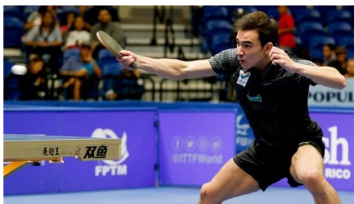
Calderanon rysty edustaa nykytyyliä, jossa palloa lyödään vartalon edestä nopeasti käsivartta käyttäen voimakkaasti

Alkuvirityksen jälkeen lyönti suoritetaan lähinnä käsivarrella suoristamalla kättä kyynärpästä eteenpäin ja kiihdyttämällä liikettä ennen osumavaihetta. Tärkeää lyönnin aloituksessa on, että olkapää pysyy rentona suorituksen aikana eikä nouse ylös. Mikäli olkapää on jäykkänä alkuvaiheessa, lyönnin vapautusvaiheessa käsi ei liiku riittävällä nopeudella eikä palloon tule vauhtia. Kyynärpään asento on lyönnissä oleellinen asia. Kyynärpään täytyy olla irti vartalosta ja hieman koholla. Ei kuitenkaan liikaa, jotta lyönti on mahdollista suorittaa pallon alapuolelta ja käsivartta voidaan käyttää vipuna lyönnin suorittamiseen. Lyöntisuorituksen jälkeen palautus takaisin valmiusasentoon.