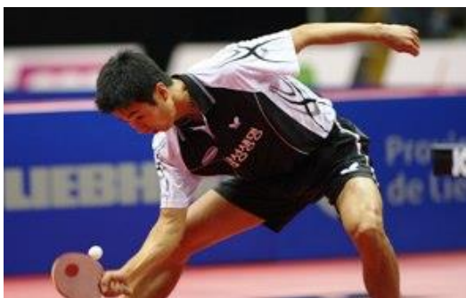
Parhaatkin puolustuspelaajat turvautuvat ajoittain kämmendeffuun, vaikka usein lähtevät lyömään vastaan

Kämmenpuolelta tekninen suoritus on käytännössä peilikuva rystypuolen lyönnistä. Lyönti lähtee noin olkapään korkeudelta, päätyen alaspäin etuviistoon. Kämmenellä palloa lyödään usein vielä alemmalla kuin rystyltä. Kierrettä voidaan vaihdella mailakulman asentoa muuttamalla sekä osuman ”paksuudella”.