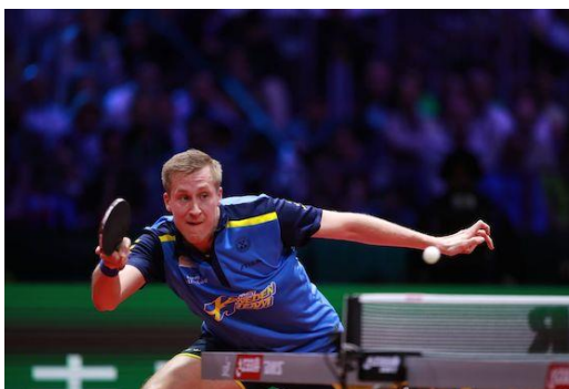
Mattias Falck

Ruotsalainen Mattias Falck eteni MM-kisoissa 2019 finaaliin, perustaen pelinsä kämmenpuolella käytännössä pelkästään tappolyöntiin. Falckilla tosin on kämmenpuolella muista pelaajista poiketen lyhyt näppyläkumi, jolla kierrettä ei ole helppo lyödä. Hän on loistava esimerkki siitä, että lajissa voi menestyä myös täysin valtavirrasta poikkeavalla pelityylillä ja tekniikalla.