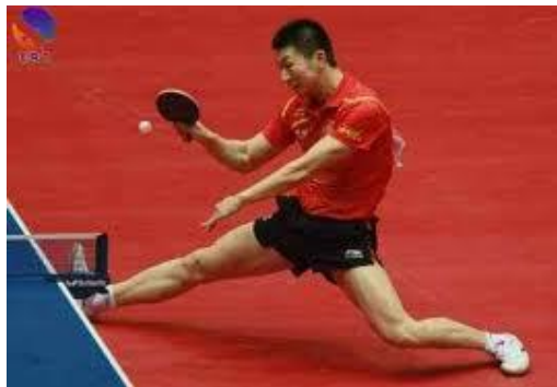
Aina edes parhaat eivät ehdi lyömään hyvästä asennosta (Ma Long, Pingsunday)

Oikea jalkatyö antaa mahdollisuuden liikkua siten, että pelaaja pystyy suorittamaan parempia, tarkempia palautuksia ja lyöntejä. Oikean jalkatyön tavoitteena on saada vartalo optimaaliseen asentoon ennen lyönnin alkua. Hyvä peliasento mahdollistaa lyöntien maksimipotentialin saavuttamisen.