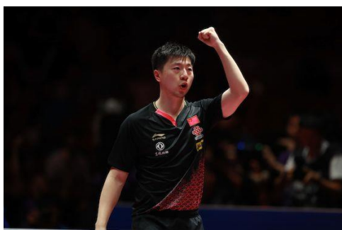
Ma Long, kolmikertainen maailmanmestari, Olympiavoittaja Yleisesti pidetty kaikkien aikojen parhaana pöytätennispelaajana. Ma Long seurasi Jiken jalanjalkia ja vei peliä jälleen askeleen nopeammaksi.

Vuosikymmenen vaihtuessa 2020-luvulle kyseinen lyönti on edelleen kärkipelaajien valikoimas- sa, mutta pelin evoluution myötä lyönti lähtee vauhdikkaammin eteenpäin. Palautusta ei enää haeta aggressiivisesti koko pöydältä, vaan se on yksi osa laajaa valikoimapankkia, josta huip- pupelaajat ammentavat kuhunkin tilanteeseen sopivia lyöntejä.