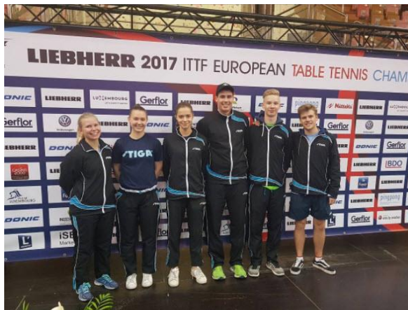
Suomen pelaajat 2017 joukkueiden EM-kisoissa

Laji on saanut lisää näkyvyyttä parantuneen viestinnän ja Benedek Olahin kansainvälisen menestyksen myötä. Se on lisännyt yhteistyötä myös Olympiakomitean suuntaan. Suomen miesten joukkue selvitti tiensä myös kevään 2018 MM-kilpailuihin.