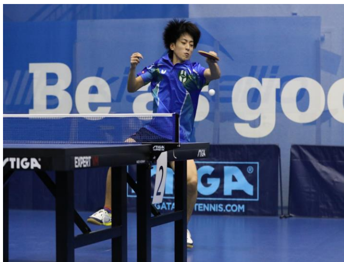
Vuoden 2016 Finlandia Openin miesten kaksinpelin voittaja Hokuto Koryama, Japani

Kilpailutoiminnan rungon muodostavat liiton hyväksymät kilpailut sekä sarjatoiminta. Merkittävimmät kilpailut ovat SM-kilpailut, joita järjestetään miesten ja naisten luokkien lisäksi kaikille ikäluokille ja tasoille. Tärkeitä ovat myös GP-sarja sekä TOP- sarjan kilpailut. Vuosittain järjestettävä Finlandia Open, on saavuttanut vahvan jalansijan kansainvälisessä kilpailutoiminnassa ja kilpailuun osallistuu tulevaisuuden lupauksia useasta maasta. Finlandia Open tarjoaa kilpailuun valituille suomalaisille pelaajille erinomaisen mahdollisuuden kansainvälisen pelivauhdin kokemiseen.