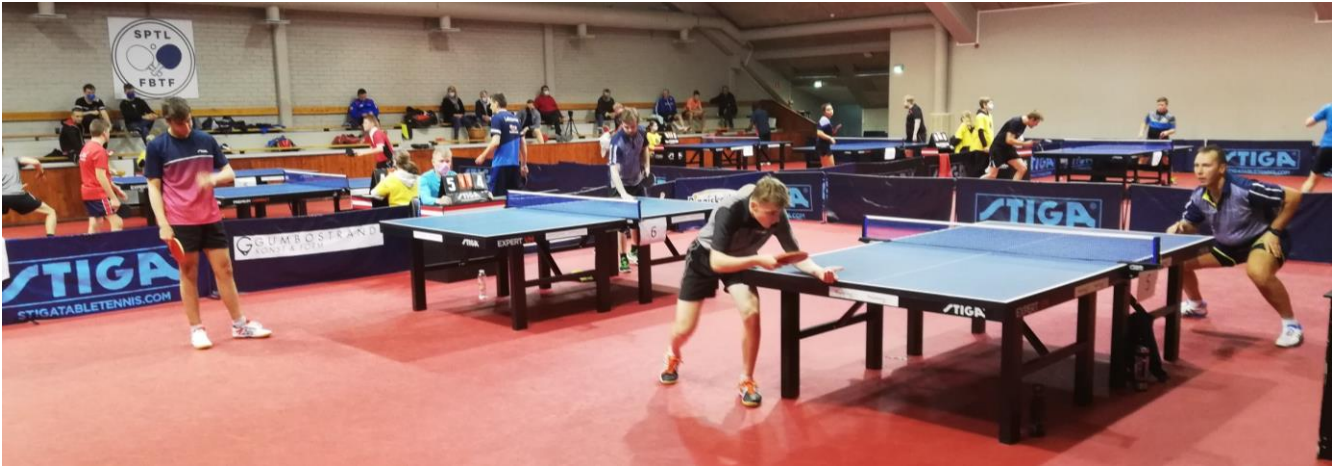
Pelit käynnissä. Etualalla ykköspaperin kahdeksan parasta pelaavat sijoista 1-12.