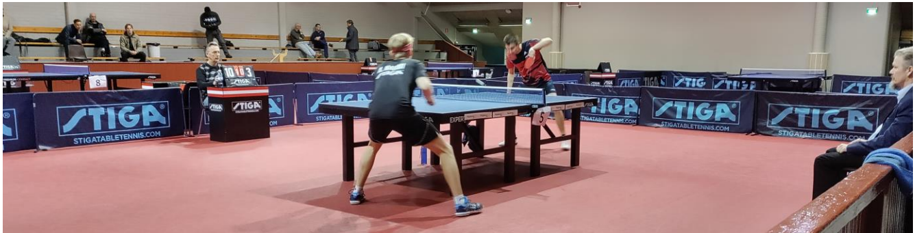
Loppuottelu: vasurivenkurasyyttö tulossa, mutta ei tunnu missään. Tulostaulu kertoo olennaisen.